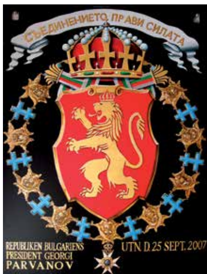
Serafimersköld nr. 850. Nutida utförande målad av Leif Ericsson 2010