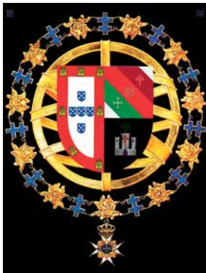
Digitalt framställd förlaga för portugisisk serafimersköld nr. 854. Målad av Leif Ericsson.

kopparplåten. Överföringen från papper till plåt är tidkrävande och stor noggrannhet fodras.