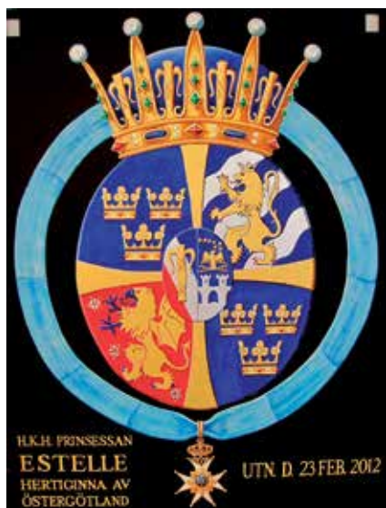
Serafimerköld nr. 861. Målad av Leif Ericsson 2012