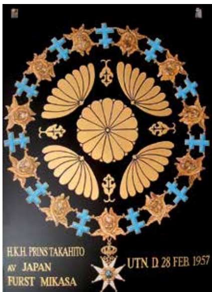
Serafimersköld nr. 733 för prins Takahito av Japan. Målad av Leif Ericsson 2010 "eget formspråk"