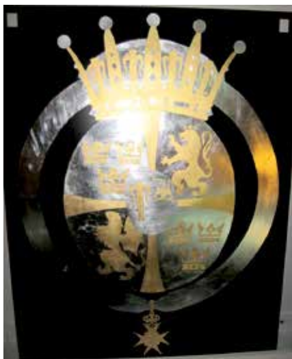
Prinsessan Estelles serafimersköld nr. 861. "Metallgrund" (ej klar vid fototillfället).

Om färgfältet läggs för tjockt eller är för täckande så försvinner metallens genomslagskraft och lustern uteblir.