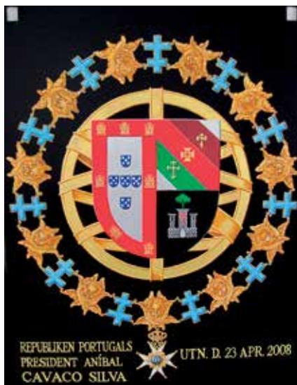
Serafimerköld nr. 854. Målad av Leif Ericsson 2013