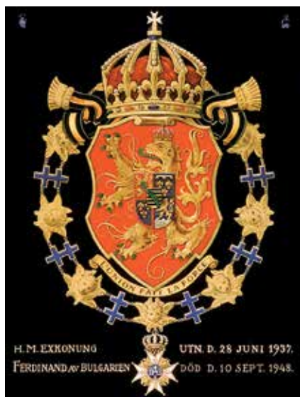
Serafimersköld nr. 688. Målad av David Friedfeldt 1937