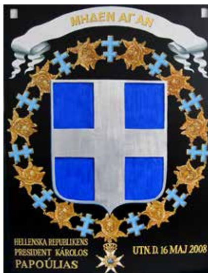
Serafimerköld nr. 855. Målad av Leif Ericsson 2013