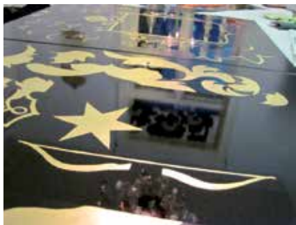
Svart grund och guld grund som härdar i väntan på aluminiumblad, privata sköldar