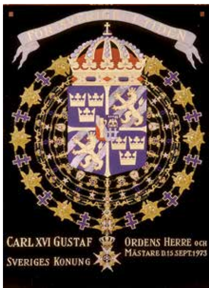
Serafimersköld nr. 700 för kung Karl XVI Gustav av Sverige. Målad av David Friefeldt 1973.

rad olika system och skriva om färger utifrån olika användnings områden.