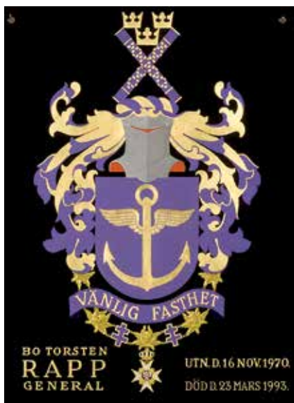
Serafimersköld nr. 768 för överbefälhavare Torsten Rapp. Målad av David Friefeldt 1972 i "flatstil".

I övrigt så avbildas inga andra ordenstecken i dag med undantaget om det ingår i nationens statsblem eller "riksvapen" till exempel Jordanien (icke heraldiskt) och Portugal del av