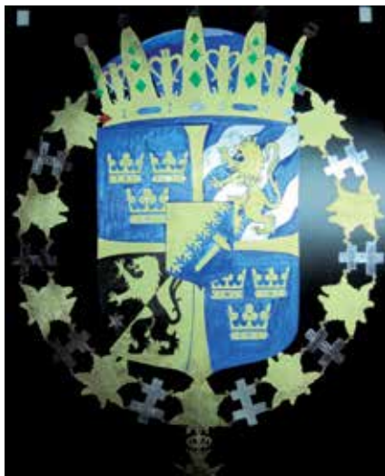
Detalj av Prins Daniels serafimersköld nr. 858. Oljelaserer (ej klar vid fototillfället).