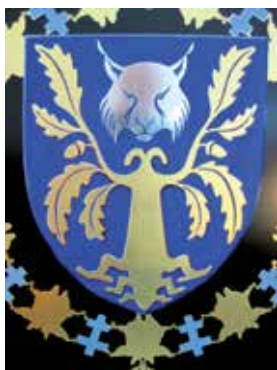
Detalj av serafimersköld nr. 859. Estlands president Ilves. "High Lights" (ej klar vid fototillfället). Målad av Leif Ericsson.